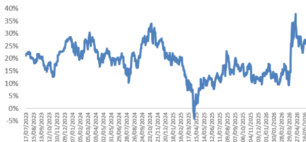
Fondo BCT Renta Variable USA Evolución del rendimiento Últimos 12 meses